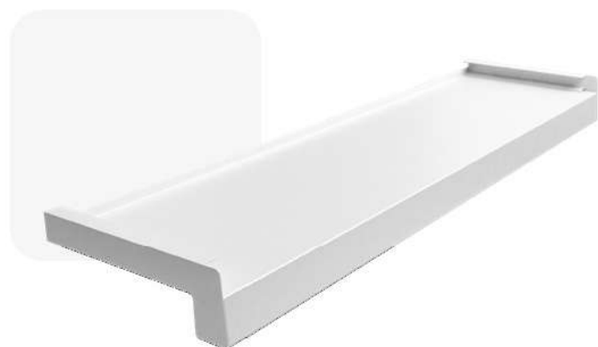
Biały RAL 9016