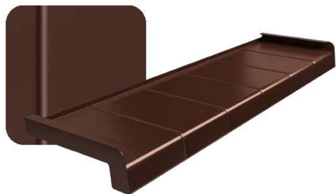
Brąz RAL 8017