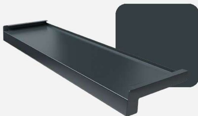
Antracyt RAL 7016