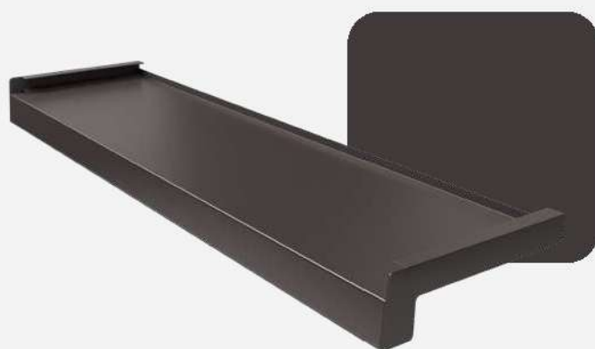
Brąz RAL 8019