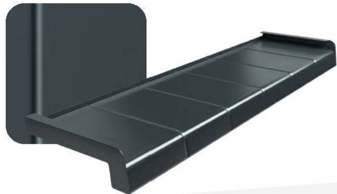
Antracyt RAL 7016