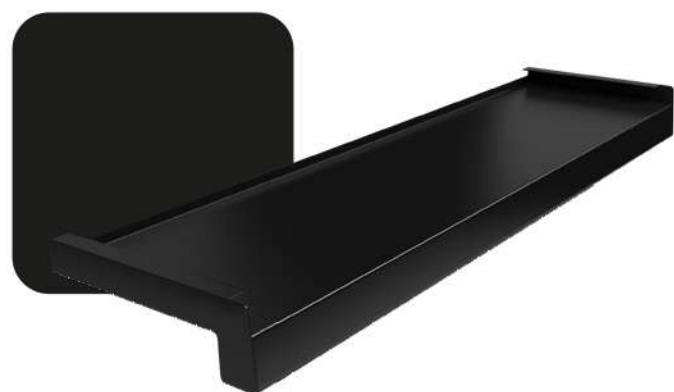
Czarny RAL 9005