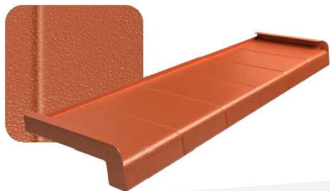
Cegła RAL 8004