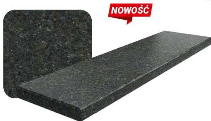
Black Antracite Lapatura