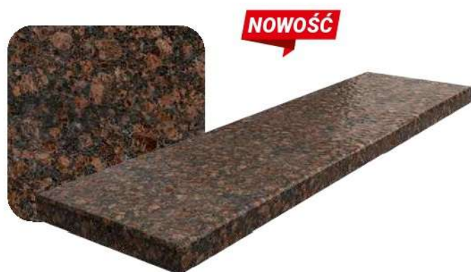
Tan Brown Lapatura

Parametry techniczne oraz opcje wykończenia pozostają identyczne jak dla tradycyjnych parapetów granitowych.