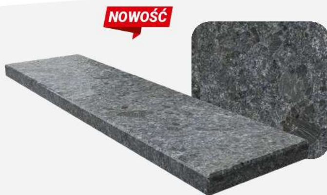
Steel Grey Lapatura